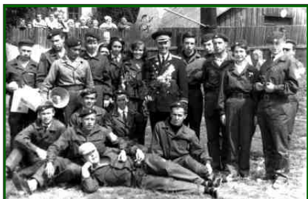
Туристический клуб «РИТМ»

Если говорить о событиях, связанных с Днем Защитника отечества, то воспоминания возвращают нас в беспокойную, романтическую и патриотическую комсомольскую юность. Праздник тогда назывался Днем Советской Армии, и наше внимание искренне и естественно устремлялось к ветеранам и представителям нашей армии. Мы вместе с ними радовались победе в Великой Отечественной войне, гордились воинами-победителями, были признательны им за отвоеванное право мирной жизни на любимой земле.