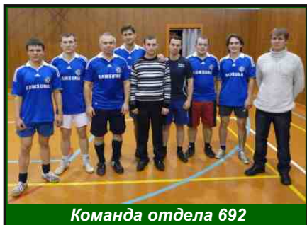
Команда отдела 692