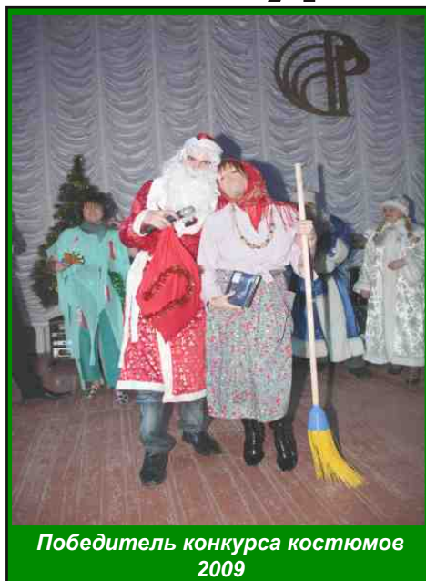
Победитель конкурса костюмов 2009

*** В преддверии самого доброго праздника профком завода объявляет конкурсы на лучшее новогоднее украшение кабинета и лучшую стенгазету отдела. Заявки на участие в конкурсах принимаются в профкоме до 24 декабря. Также объявляется конкурс на лучшее новогоднее поздравление. Ваши сочинения собирает почтовый ящик для редакции газеты "Маяк", который находится на проходной. Подведение итогов конкурсов состоится 27-28 декабря, а победители будут оглашены на новогоднем вечере, который состоится 29 декабря в актовом зале завода. На самом торжестве вас ждет конкурс карнавальных костюмов. Оцениваться будет оригинальность костюма и презентация персонажа.